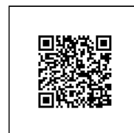
Zažádejte o vytyčení

Přílohy: Orientační zakres plynárenského zařízení, Detailní zakres plynárenského zařízení, Ověřená příloha žadatele, Ověřená příloha žadatele